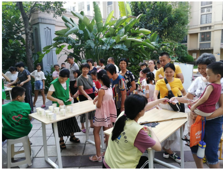
居家安全知识游园会

“关系维度”，以兴趣发展、关系互动、传统节庆等为主题，丰富居民文化生活，搭建居民互动交流桥梁，培育居民生活组织，推动新型小区的熟人关系再造。